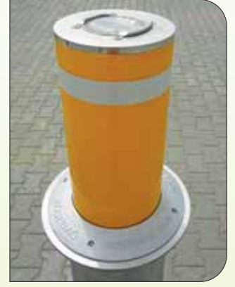
HİDROLİK VE PNÖMATİK MANTAR BARIYERLER / HYDRAULIC & PNEUMATIC BOLLARD